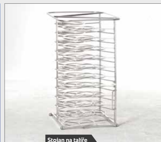
Stojan na talíře