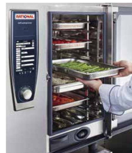
Mise en place.