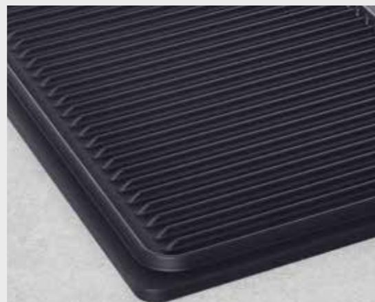
Deska na grilování a pečení