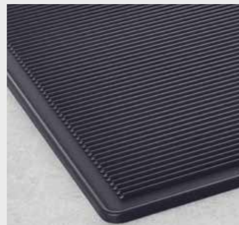
Deska na grilování a pizzu