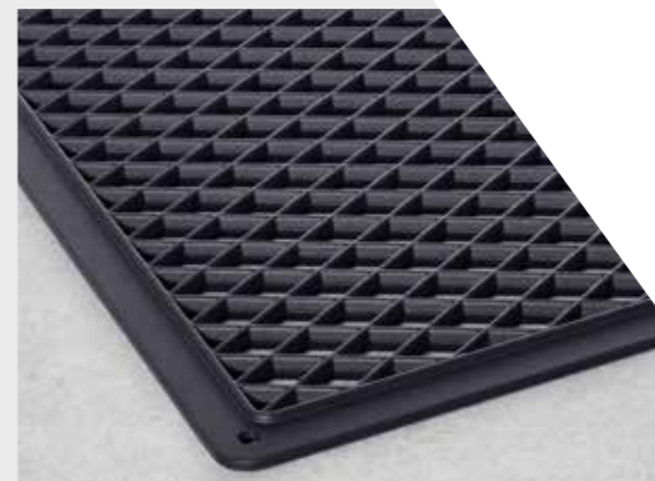
Křížový a proužkový grilovací rošt