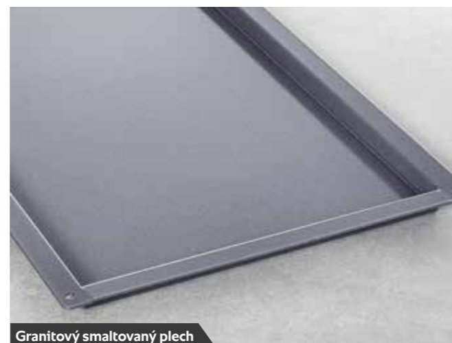
Granitový smaltovaný plech